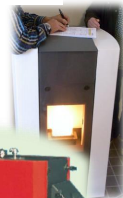
ペレットボイラー